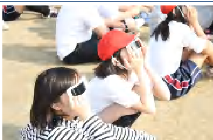
午前7時33分頃、金環日食を観測しながら、ワーツと歓声を上げる児童達(於:銚田小校庭 H24.5.21)